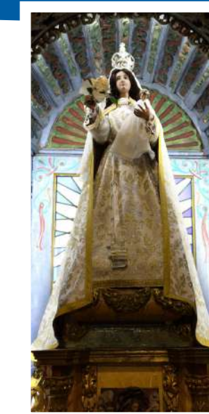
Nuestra Señora (Santa María)

En su fachada medieval destaca la imagen de la Virgen con el Niño (s. XVI) que, coronada con dosel en forma de vieira, está situada entre el rosetón y la puerta en arco de medio punto, que sustituyó a la original en el siglo XVI. La torre-campanario del s. XVIII se ubica hacia el sur, a la derecha de la fachada, y se levantó a imitación de la de San Xenxo de Padriñán.